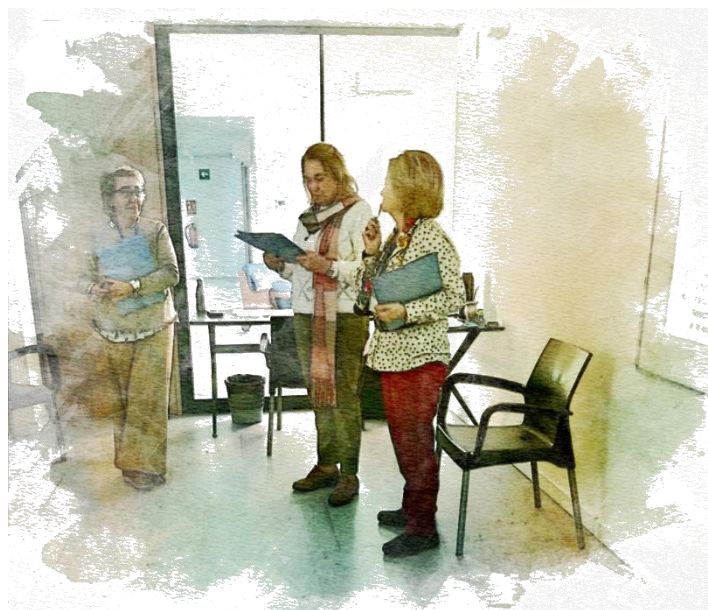
El taller alternó momentos de trabajo personal con dinámicas de trabajo en grupo y plenarios